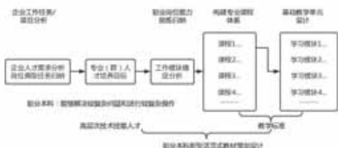
图2 构建专业课程体系及教学标准流程

(4) 基础学习单元设计,以课程模块化为基本教学单位,即根据职业特征的六要素及完整思维的六步骤,将学习领域分解为主题学习单元。并在此基础上形成教学标准,为新型活页设计教材的策划设计奠定基础 [8] 。构建专业课程体系及教学标准流程如图2所示。