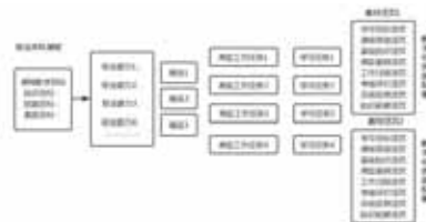
图3 新型活页式教材的结构框架设计

评价活页、总结反思活页、知识拓展活页等。学生可以从学习目标入手开展知识学习和技能实践。同时配套数字化资源,形成更多可听、可视、可练、可互动的职业本科新型活页式教材。结构框架设计如图3所示。