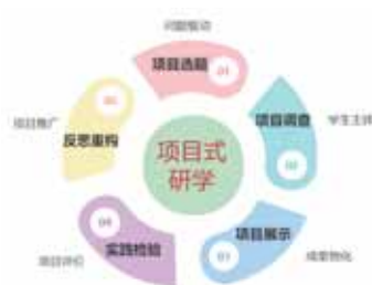
图1 基于项目式研学流程图

研学旅行教学的实质就是通过旅行活动开展研究性学习,本文将项目式学习与高中生研学旅行教学融合在一起,旨在提高研学旅行的质量和成效 [3] 。项目式学习的核心特征有任务驱动、学生主体、学科融合和成果物化等,较之传统的主题式研学,项目式学习更能促进预设与生成的有机融合,更能激发学生的学习内驱力。项目式学习对于提高研学成效和质量具有重大价值,集中体现了自愿、自主、团队、策划、展示、考核等综合育人的教育功能。笔者将项目式学习和研学旅行深度融合,其流程如图1所示: