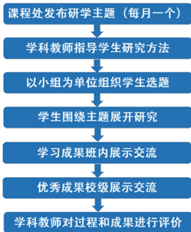
图2 人文学科公共研学活动流程图

教师利用选修课、社会大课堂、综合实践活动课、研究性学习课和课余时间，通过讲授、视频观看、实地参观、社会调查、野外实践、小组讨论等形式，组织学生进行公共主题的微课题研究活动。每一个主题的研学都按以下步骤展开（图2）。