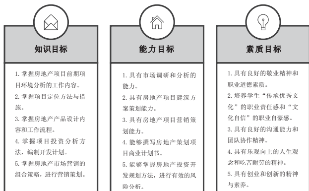
图1 “房地产策划实训”课程教学目标

从现实角度分析来看,开展实训教学的根本目的在于通过系统化的实训教学活动,形成房地产项目的决策咨询能力、建筑方案策划能力、营销策划能力,基于高校立德树人的总目标,培养“互联网+智能+时代房地产经营与管理”一线岗位需要的高素质技术技能人才,本课程从知识、能力和素质三个方面确定课程人才培养目标,如图1所示。