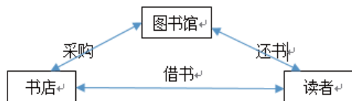
图1 城市实体书店纸质图书PDA采购流程

内蒙古图书的“彩云服务”、杭州图书馆推出的“悦读服务”、南京图书馆“陶风采”、铜陵图书馆的“你选书，我买单”，以及我们馆的“你阅我买”都是在新华书店直接设立了公共图书馆的借阅专柜。公共图书馆读者可以在新华书店查阅新书，并且可在办理借阅手续后即可将该书借回家，阅读完后归还到图书馆即可，而一段时间后，新华书店根据清单与图书馆进行核对并结账，具体流程如图1所示。