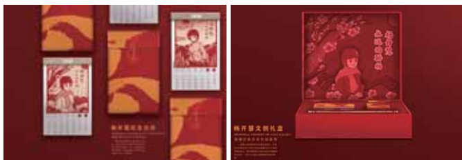
图2 杨开慧纪念文创日历

合,满足红色文创产业对湖南红色文化传承人才的实际需求。一方面,要尽量覆盖红色文创产业消费人群。红色文创行业的用户年龄层上至中老年人,下至儿童,不同群体对设计的需求不同,审美也不同,这时就需要通过用户群体的需求、心理分析调整设计结构,既要开发出工艺复杂精美的红色文创设计,也要开发出小巧精致的红色文创设计点缀。如图2、图3所示,杨开慧文创礼盒里面有:杨开慧绘本、钢笔、文件夹、胸针等。这些设计形象生动,在满足众多消费者需求的同时,能够产生连带传播的作用和价值。另一方面,注重红色文创的鲜活形式,创意始终是红色文创产品的重要手段,不断开发和吸纳优质创意,为红色文创产品开发提供更多可能。红色文创设计传承的是精神内核,红色文创设计让红色文化永葆活力,让红色文化融入当代人的血脉,通过具体落地开发的红色文创产品去回顾党的历史、精神遗址、传播党史知识,从而凝聚起中华民族伟大复兴的精神动力。正是红色文创的魅力,国内近年来开展了丰富多彩的竞赛和展览活动,如“上海红色文化创意大赛”由中共上海市委宣传部、中共上海市委党史研究室、中共上海市委教育卫生工作委员会等单位联合主办,围绕“弘扬伟大建党精神”和“展示辉煌发展成就”两大主题展开,通过时尚性、创意性、实用性的文化创意设计,传播红色文化。