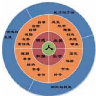
图3 本幼儿园绘本剧课程培养目标

作为本园的特色课程，绘本剧特色课程的目标紧紧围绕我园生活化课程的总目标，即培养具有良好品行、高尚审美、和谐文雅、乐于探究以及全面发展的幼儿。从幼儿发展的角度来讲，它包括知识与技能、情感与态度、能力与方法这三个方面，绘本剧综合课程的目标就围绕这三个方面开展。具体内容可参见图3。