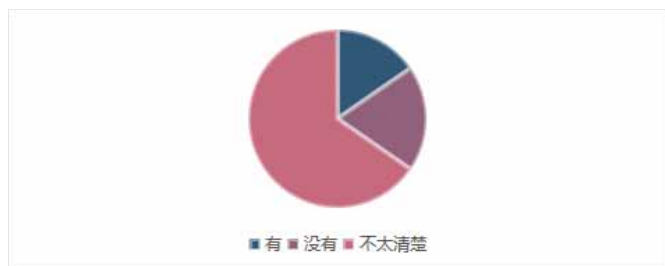
图3 被调查者对当地学前瑶汉双语教育相关文件的了解情况统计

无法起到很好的效果。随着瑶族老人的逝去，古瑶可能会在我们的生活中消失，同时伴随着讲白话瑶人群的不断减少，瑶语的传承与保护会面临较大的困境（如图3）。