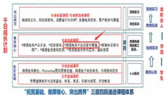
图1 《跨境电商平台运营与管理》在专业课程设置中的地位

《跨境电商平台运营与管理》作为跨境电子商务专业的专业核心课程之一,根据专业人才培养方案及课程标准,结合本土跨境电子商务平台运营与管理岗位要求,立足“一带一路”背景下的我国跨境电子商务运营角度,围绕账号运营、选品开发、产品刊登、营销推广、物流管理等多方面展开教学,同时基于课程立足速卖通、eBay、亚马逊、Wish等跨境电商平台运营、以及跨境电子商务专业学生创业就业所面对的国际交往实际,对该课程进行课程思政建设显得非常必要。因此本课程在详细讲解关于各平台的基本规则、实操技巧、做好运营的思路与方法等内容的同时,培育学生具备坚实的政治方向,较高的思想素质和强烈的社会责任感,将价值观、职业道德和职业素养等思政内容渗透融入各教学任务,使价值观形成与知识学习、技能培养有机结合,让专业课程服务于学生成长与技能发展,培养学生成为社会所需的