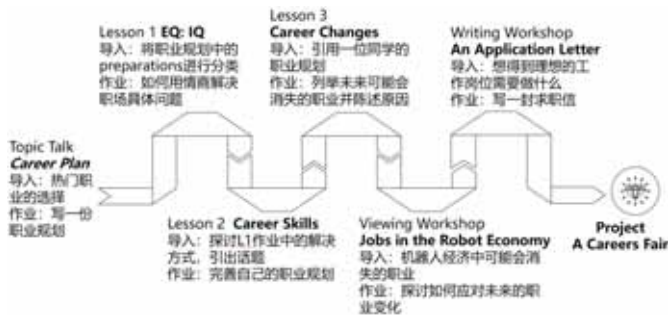
图四 Unit 7 Career单元教学活动关联图

(1) 单元整体课堂表现性评价。在进行教学评价时，教师要设计有层次、有逻辑和有内在关联的评价活动。在整个单元学习的过程中，教师通过多元评价方式检测学生的学习效果。在每课时结束后，教师让学生填写单元学习效果评价表（见下图），使其评价自身学习情况；在完成整个单元的学习后，教师引导学生基于“careers”的主题，绘制思维导图，呈现自己对此话题的认知。最终，教师令学生通过Project中“模拟招聘会”的挑战性学习任务，检测学生是否为未来求职做好一定准备，评价学生是否能运用所学解决其自身生活中的问题。可见，教师要将课程内容六要素与单元教学内容相结合，制定学习效果评价标准，切实观察学生在单元学习过程中的素养进阶。